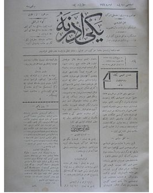
Kurucusu olduğu Yeni Edirne gazetesi