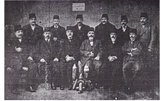
Şevket Bey, 1913 Balkan Savaşı'nda Edirne'nin işgal günlerinde [4]